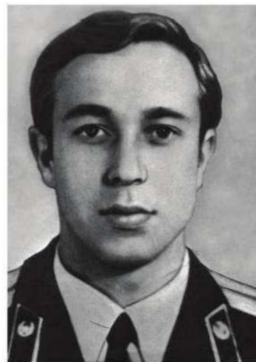
ВЛАДИМИР ПРАВИК (1962 — 1986)