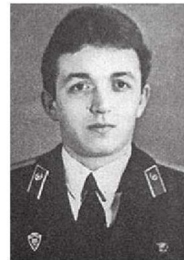
ВИКТОР КИБЕНОК (1963 — 1986)