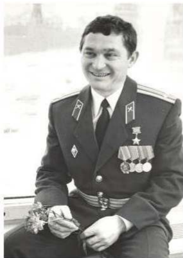
ЛЕОНИД ТЕЛЯТНИКОВ (1955 — 2004)